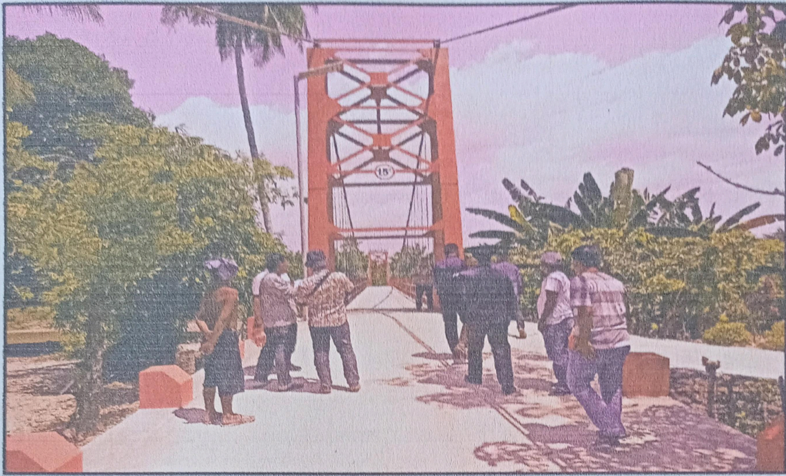
FOTO VISUAL PERHITUNGAN BERSAMA HASIL PEKERIAAN